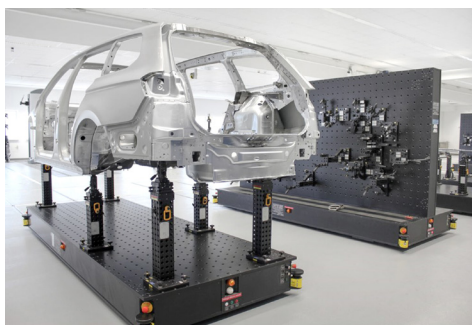
Foto rechts: seiner Alu-Strukturplatten in Sandwichbauweise bietet Witte eine Vielzahl intelligenter Fahrerloser Transportsysteme (FTS).

Foto links: Kapazitätsausweitung bei Witte Barskamp: Spezielle Werkshalle für die Elektromontage und Qualitätsprüfung von Fahrerlosen Transportsystemen